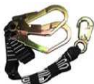
Talabarte para ancoragem