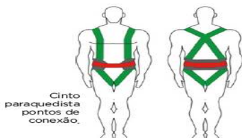
ILUSTRAÇÃO 2 – USO CINTO DE SEGURANÇA

Na dúvida, SEMPRE pergunte ao responsável;