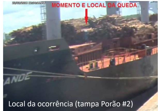
ILUSTRAÇÃO 1 – ESTIVAGEM DA CARGA

O trabalhador estava realizando o desembarque de madeira no navio e ao realizar o acesso do porão para o convés, se apoiou em uma lingada de madeira estivada sobre a tampa do porão e ao segurar em uma das madeiras da lingada, uma delas veio a se soltar (madeira quebrada), ocasionando a queda do trabalhador sobre o braço direito gerando uma lesão no punho.